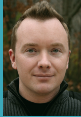
필 한센(PHIL HANSEN)

약속을 통해 더 나은 세상을 만들기 위한 비영리 캠페인인 "Because I said I would"의 창시자인 쉰은 아버지를 잃은 후 "약속의 카드"를 전세계 사람들에게 무상으로 제공하기 시작했으며 2년 동안 전세계 82개국에 250,000개의 카드를 보냈습니다. 이 카드에 적힌 약속들은 뉴스의 헤드라인을 장식해왔습니다. 쉰 또한 자신과의 약속을 지키기 위해 10일 동안 240마일을 걸으며 오하이오주를 횡단하기도 했습니다.