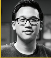
알렉스 쉰(ALEX SHEEN)

약속을 통해 더 나은 세상을 만들기 위한 비영리 캠페인인 "Because I said I would"의 창시자인 쉰은 아버지를 잃은 후 "약속의 카드"를 전세계 사람들에게 무상으로 제공하기 시작했으며 2년 동안 전세계 82개국에 250,000개의 카드를 보냈습니다. 이 카드에 적힌 약속들은 뉴스의 헤드라인을 장식해왔습니다. 쉰 또한 자신과의 약속을 지키기 위해 10일 동안 240마일을 걸으며 오하이오주를 횡단하기도 했습니다.